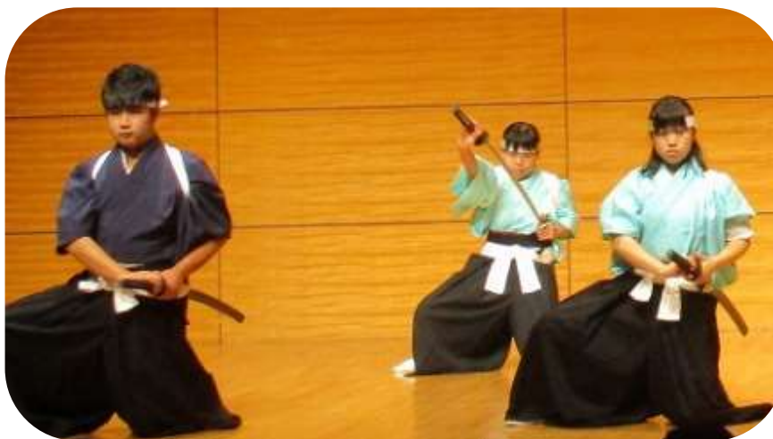
アトラクション 吟詠剣詩舞 栃木県立聾学校中高等部の皆さん